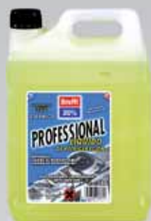
ANTICONGELANTE REFRIGERANTE CC 20%