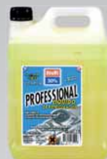
ANTICONGELANTE REFRIGERANTE CC 30%