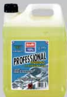
ANTICONGELANTE REFRIGERANTE CC 10%

Contiene además aditivos anticavitación, anticalcáreos, antiespumantes, una reserva neutralizante que protege eficazmente el motor, radiador, bomba de agua y circuito de refrigeración.