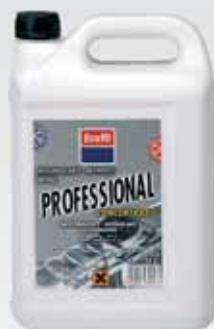
ANTICONGELANTE REFRIGERANTE CONCENTRADO UNIVERSAL